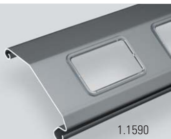
1.1590 avec vitrée