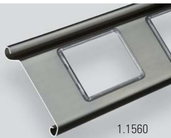
1.1560 avec vitrée