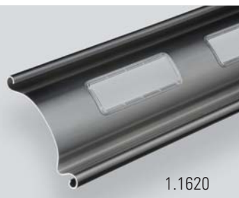
1.1620 avec vitrée